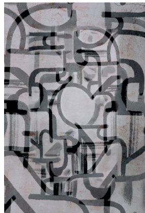
Chroniques, 2015, 120 x 80 cm.