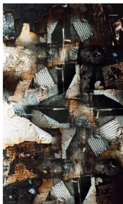
Intramuros, 2015, 120 x 75 cm.

Du 6 novembre au 5 décembre 2015, la Galerie Maeght présente l'œuvre photographique d'Olivier Dassault. Sur une commande d'Isabelle Maeght, l'artiste propose un nouveau regard inspiré par la ville au gré des déambulations du capitaine d'industrie. Un ensemble de tableaux photographiques abstraits et sculpturaux dédiés à la rencontre lumière-matière.