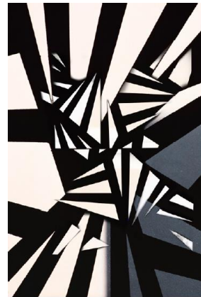
Abstract, 2015, 120 x 120 cm.