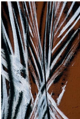
Censure, 2015, 120 x 80 cm.

« Mes photographies se nourrissent de mon approche mathématique et musicale autant que de ma passion pour la peinture. En ce sens, exposer à la Galerie Maeght, où de si grands artistes se sont succédés tant pour montrer leur peinture que leur sculpture, leur œuvre gravé et photographié, m'ouvre les portes d'un merveilleux dialogue imaginaire », explique Olivier Dassault.