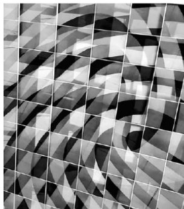
Pictogramme, diptyque, 2015, 2 x 120 x 120 cm.