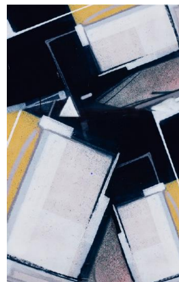
Eloquence, 2015, 120 x 80 cm.

Olivier Dassault, compositeur d'images. Le parcours d'Olivier Dassault relève de l'inédit en même temps qu'il s'inscrit dans la grande tradition des artistes passionnés par les sciences et engagés dans le monde. Grand patron, mathématicien, pilote émérite, ingénieur de l'École de l'air, docteur en informatique, député de l'Oise, Olivier Dassault développe avec rigueur et constance depuis sa jeunesse une œuvre reconnue de musicien et de photographe. À l'invitation d'Isabelle Maeght, Olivier Dassault présente à la Galerie Maeght, à l'occasion de la manifestation « le mois de la photo », un ensemble inédit de photographies sur le thème du mur.