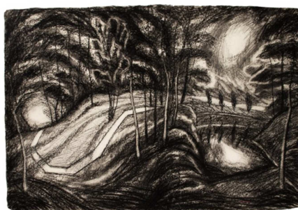
Interior III 2016 fusain sur papier 60 x 80 cm