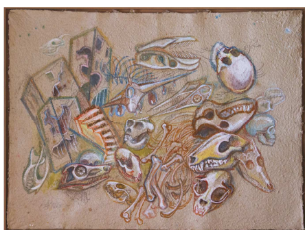
Wilderness I , 2016, aquarelle sur papier Népal, 116 x 150 cm.

Centre métaphorique des œuvres peintes ou dessinées, l'eau – source, étang ou grand étendue – ponctue cette série et lui donne son caractère. Source de vie et objet de culte, elle prend ici la fonction du reflet, de cette humanité qui prend du recul et s'attarde sur sa propre réflexion.