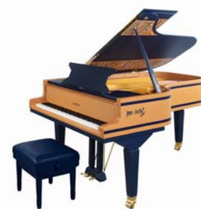
« Alèssido » – 2006 Jean Cortot pour la réouverture de la Salle Pleyel