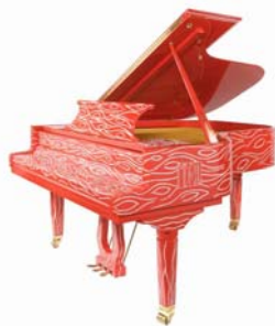
« Erato Humana Est » - 2006 Marco Del Re

Un aperçu des autres modèles de la collection :