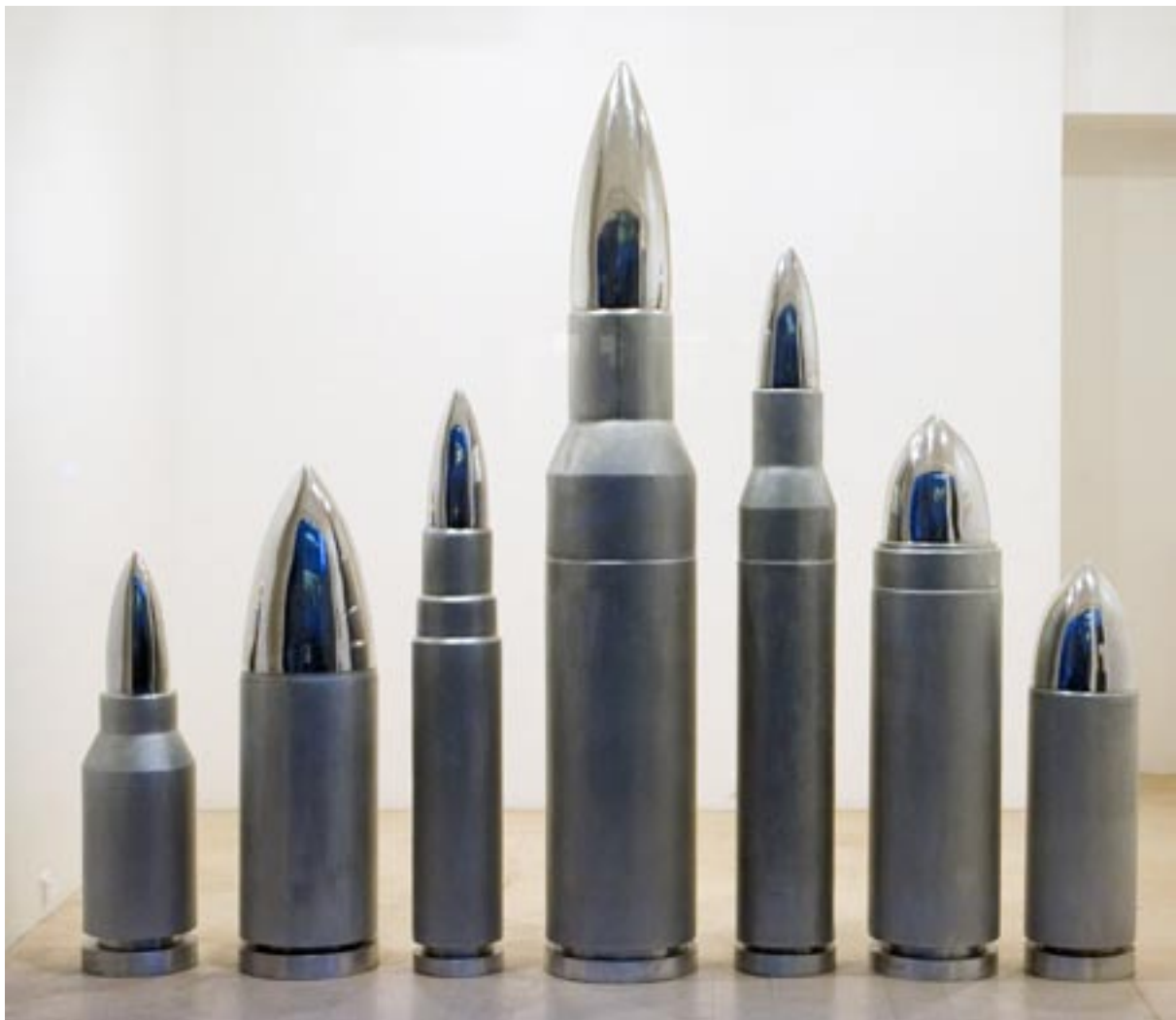
The magnificent seven , 2007, aluminium, hauteur 250 cm, largeur totale 300 cm © Philippe Perrin