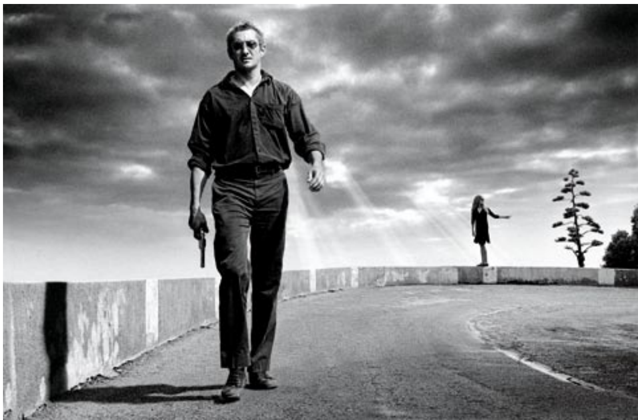
Nice is Nice , 2001, photographie noir et blanc, 180 x 120 cm © Philippe Perrin

Directeur de la Maison Européenne de la Photographie