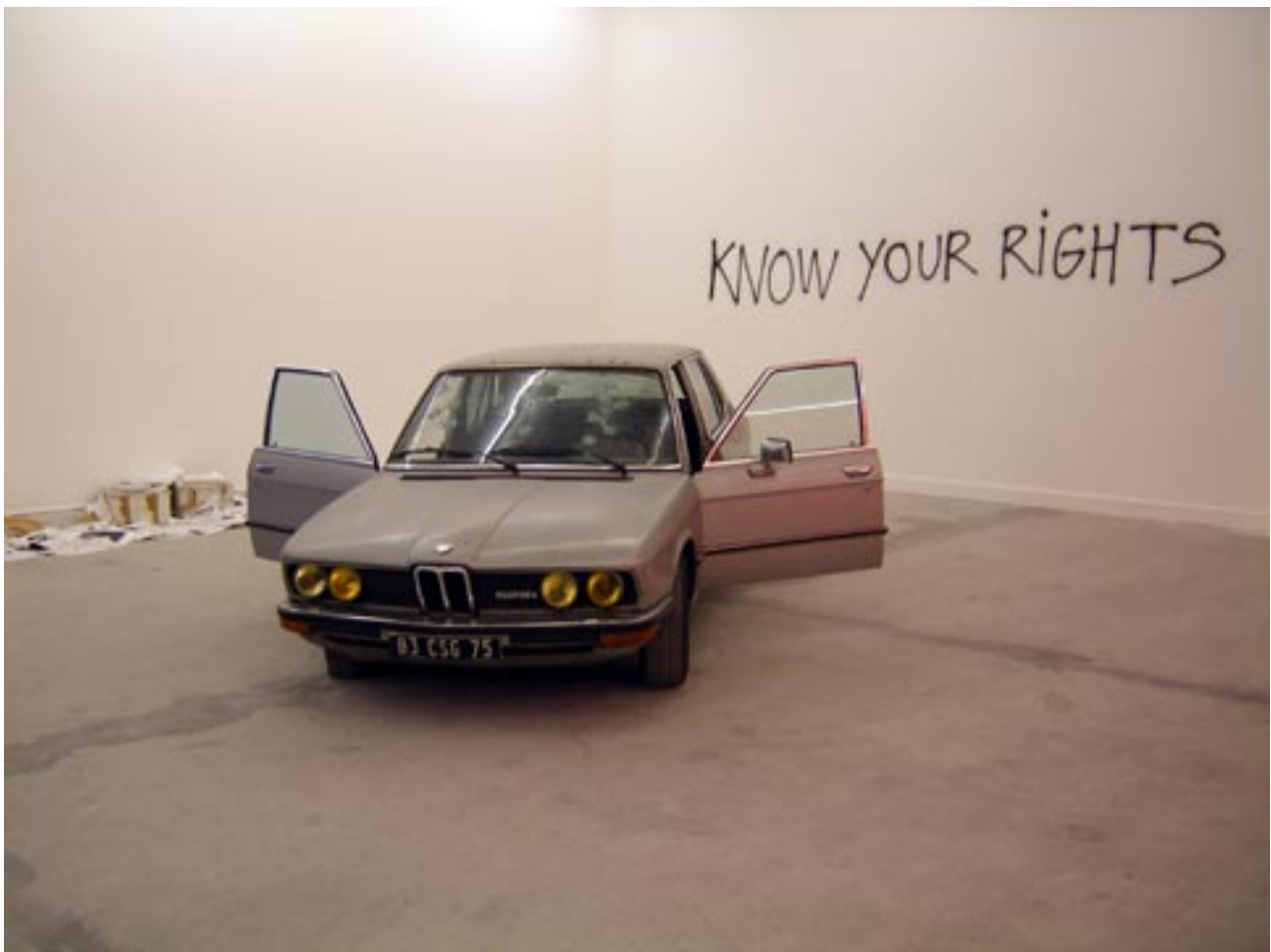
Know your rights , 1991 (tribute to Jacques Mesrine). Installation, Biennale de Lyon © Philippe Perrin

Director, Maison Européenne de la Photographie