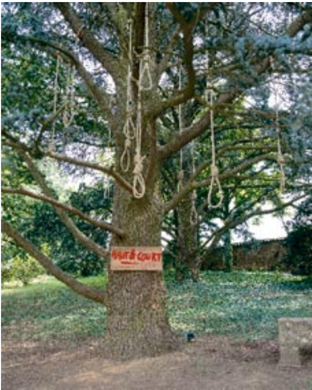
Haut et Court , 1997, installation © Philippe Perrin