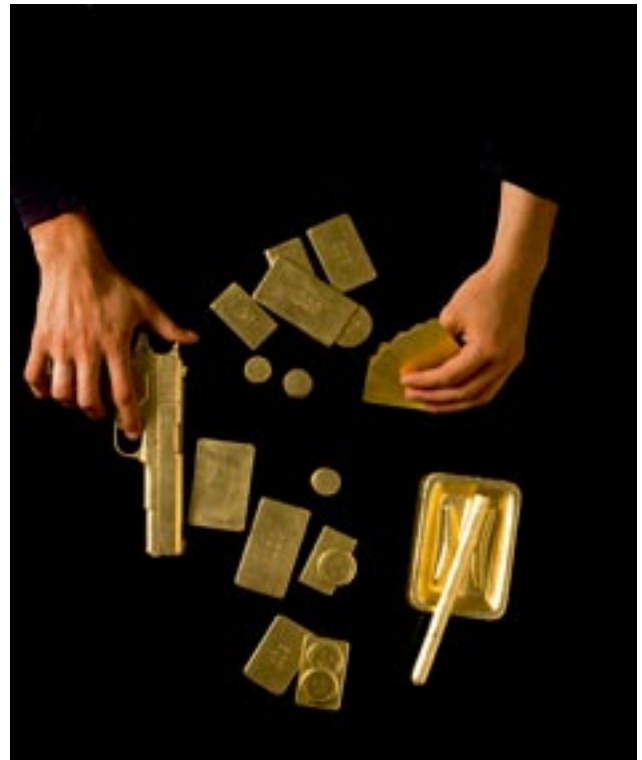
Starkiller , 1991, photographie 180 x 120 cm © Philippe Perrin