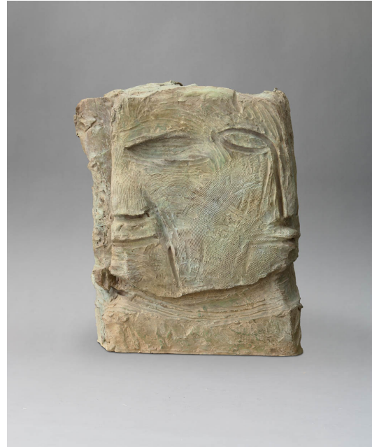
Byzantin moderne, bronze, 2009, 90 x 75 x 67 cm

Curieux d'éprouver son art au contact de différentes techniques, Marco Del Re poursuit son œuvre à travers la sculpture, capable de donner une autre dimension à son attrait pour les formes et les volumes. Via ses sculptures, Marco Del Re offre une nouvelle lecture de son travail : de la rencontre d'images chères à l'artiste naît une création originale, que l'on peut découvrir sous tous ses angles, ou appréhender dans son ensemble. Les sculptures présentées cet automne à la Galerie Maeght, évoquent des visages larges, figés mais sereins, des attitudes hiératiques au regard fixe et absent, et nous rappellent la sculpture d'ornement de l'art byzantin et assyrien. Réalisés en Italie, ces bronzes patinés imitent la couleur de la pierre des temples romains dans lesquels s'expriment les héritages étrusque et grec.