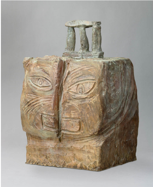
Assyrien moderne, bronze, 2009, 110 x 70 x 63 cm

Exposition du 24 septembre au 21 novembre 2009