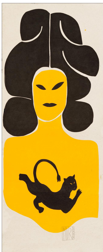
Madame Butterfly III, encre sur papier Népal, 300 x 120 cm

Exposition du 24 septembre au 21 novembre 2009